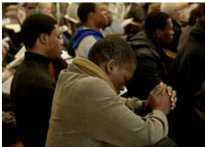
Devant la Châsse de saint Vincent de Paul