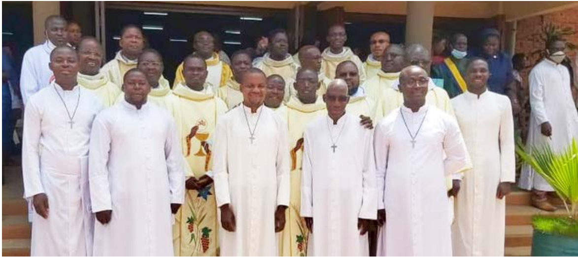
Les Pères et Frères présents