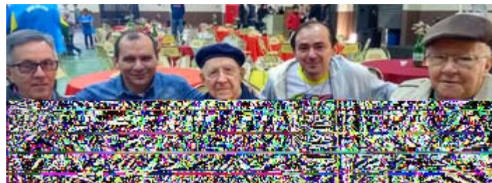
Os dois mais jovens RSV e os dois mais velhos