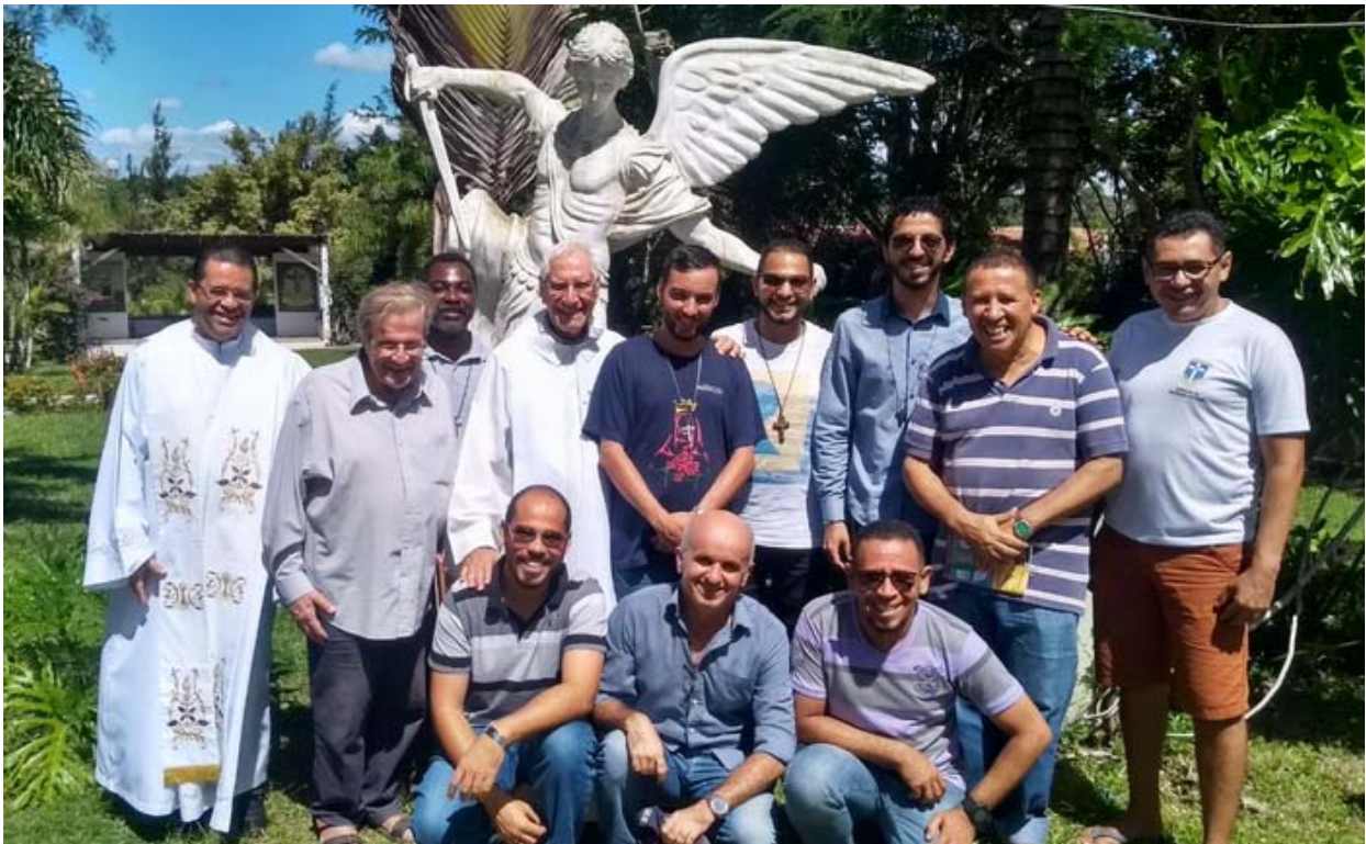
Os RSV do Nordeste do Brasil com o seu pregador