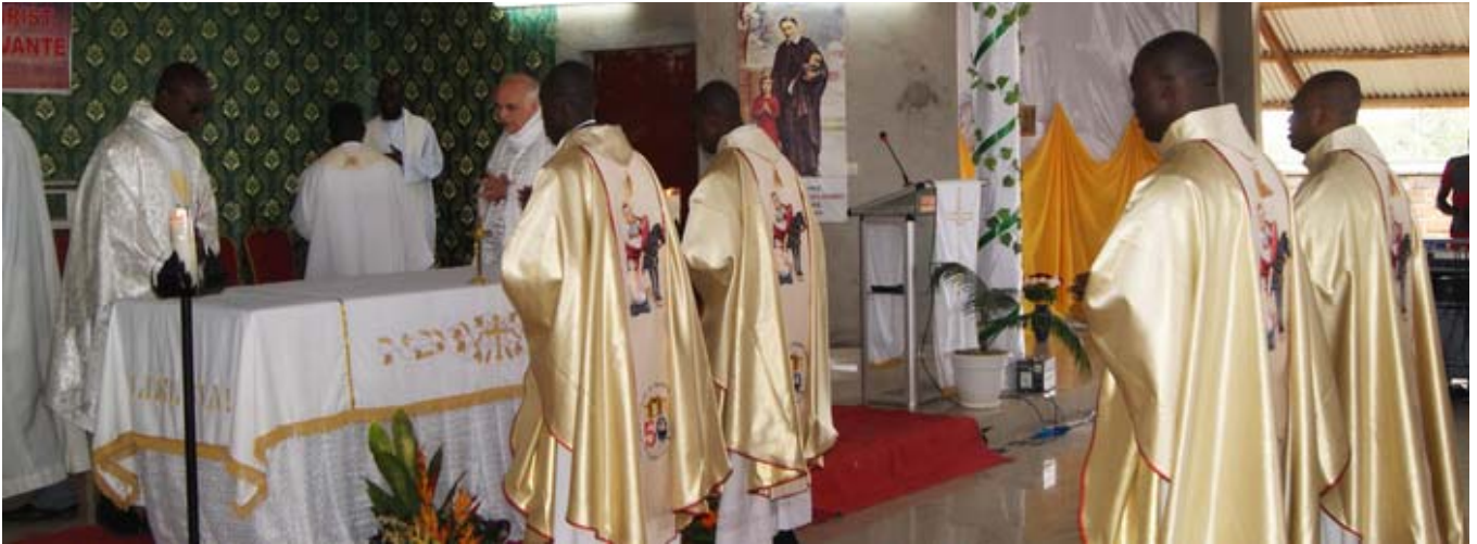
A primeira missa na paróquia São Vicente de Paulo de Bouaké

Demos graças a Deus por sua fidelidade e ternura para com os nossos jovens Irmãos e para com nossa Família religiosa!