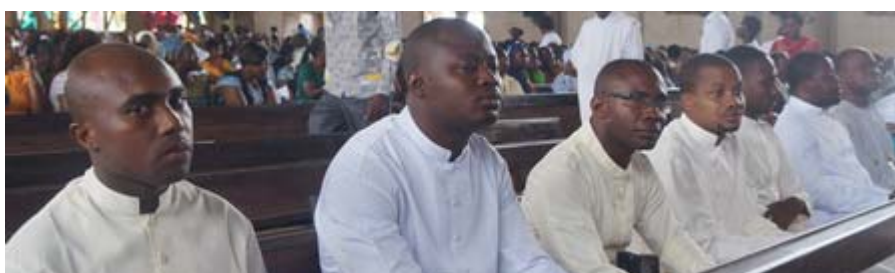
Os Irmãos e os junioristas da África do Oeste