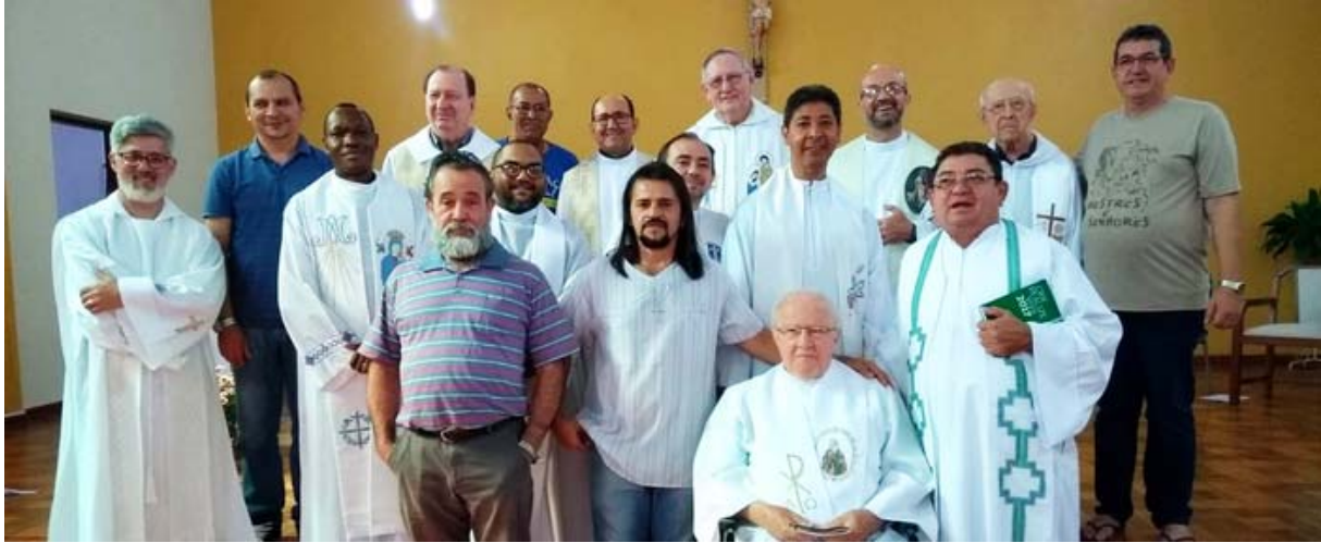
Os RSV do Sudeste do Brasil com o seu pregador