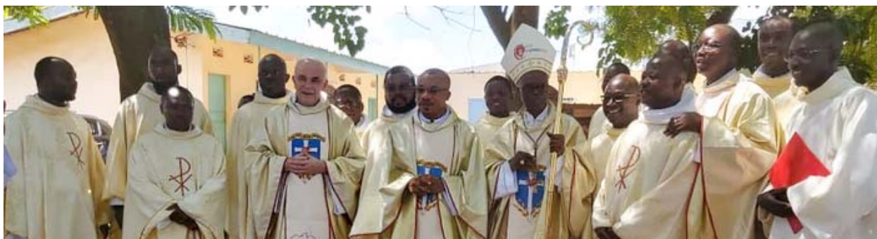
Tous les jeunes en formation avec les Supérieurs, les Formateurs et les RSV de St-Étienne