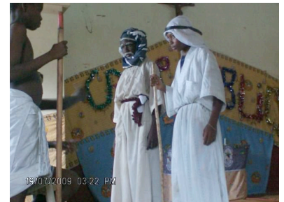
Mime vie de Moïse