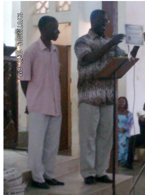
Diplôme d'excellence remis par Fr Denis au papa animateur

An cours de la messe nous avons récompensé un des parents qui faisait partie de l'équipe d'animation en lui décernant un diplôme d'excellence d'animation.