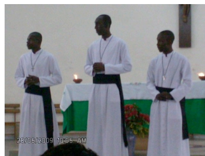
Accueil des jeunes profès à la paroisse St Martin

Nous leur souhaitons une bonne route sur le chemin de la vie parfaite et espérons que d'autres jeunes suivront leur exemple.